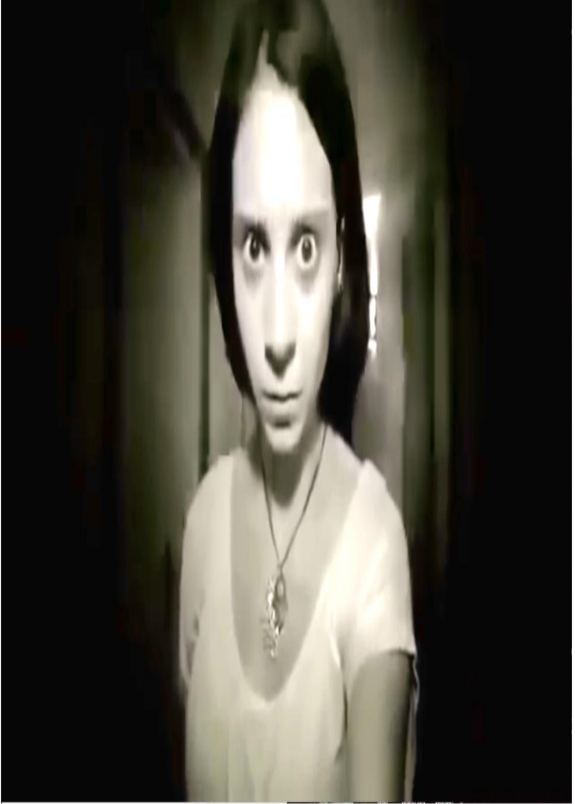
Şekil 9. 3. Dabbe Filmi Kamerada Cine Bakma Sahnesi