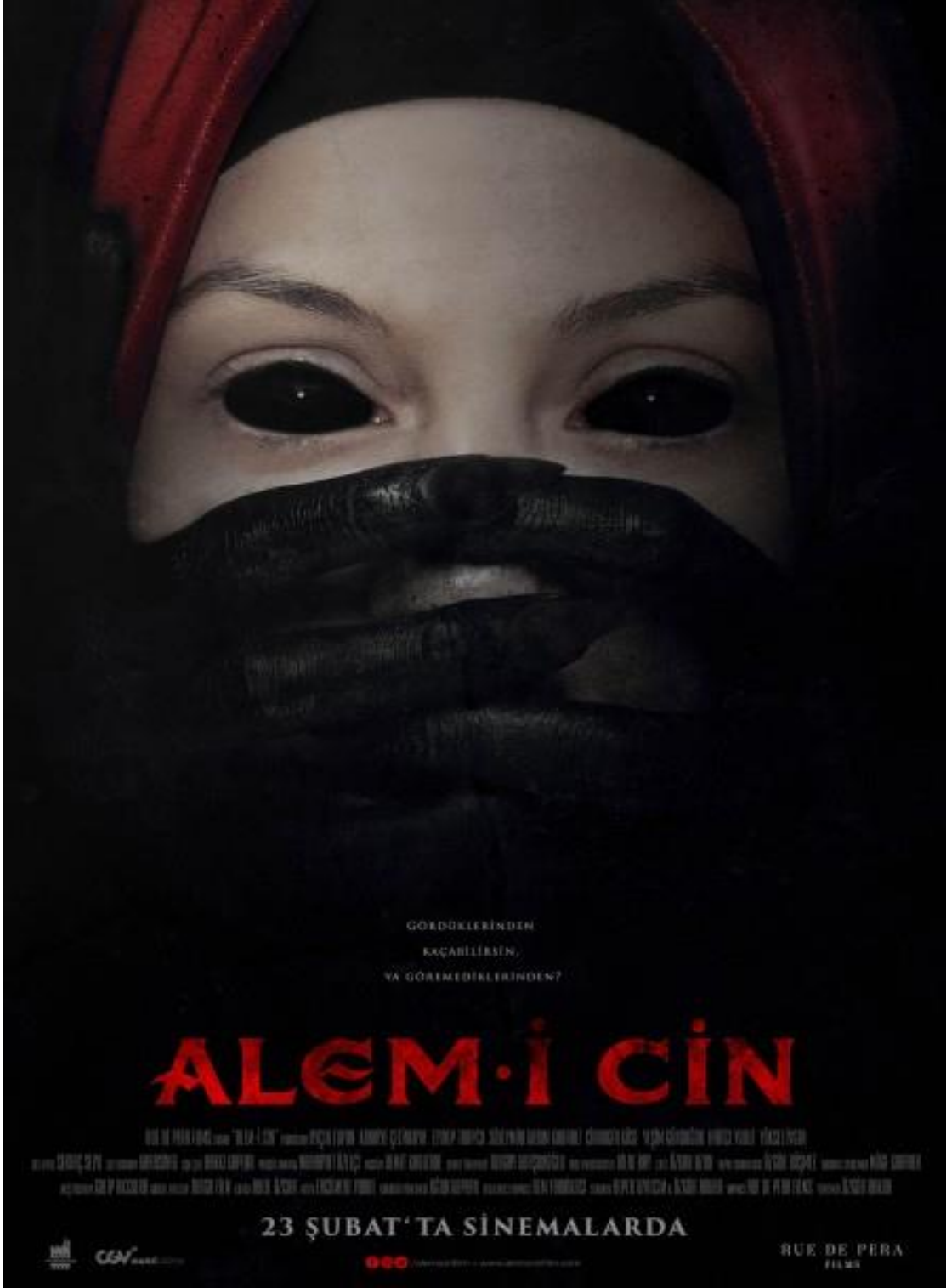
Şekil 12. 3. Alem-i Cin Filminin Afışı