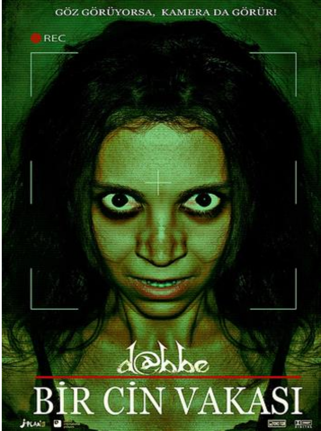
Şekil 4. 3. Dabbe Bir Cin Vakkası Film Afışı

1.Filmin Adı: Dabbe “Bir Cin Vakası” ( 2012 Hasan Karacadağ ) Filminin Göstergibilimsel Olarak Çözümlemesi