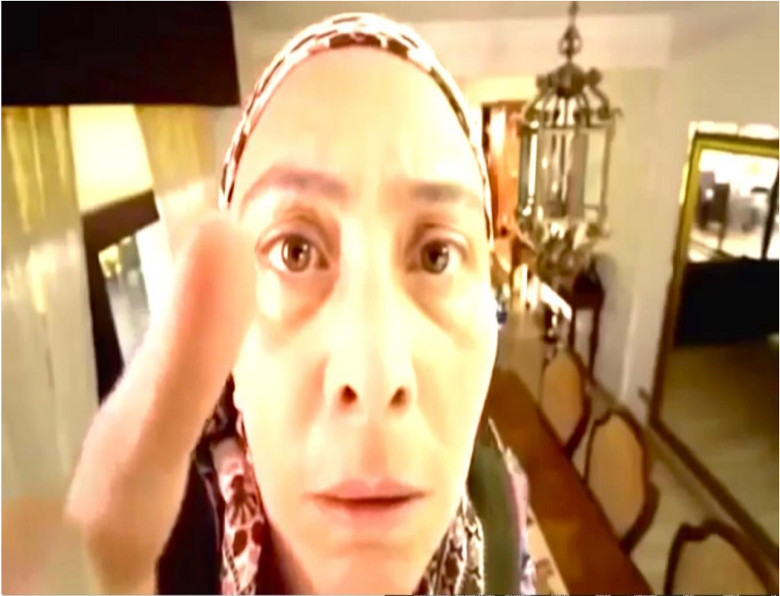
Şekil 6. 3. Dabbe Filmi Cin'e Dokunma Sahnesi