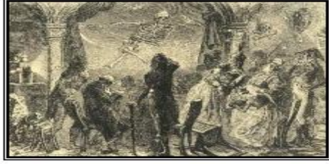
Şekil 2.1. Fantazmagorya Gösterimi ve Halkın Tepkisi (Ceram, 2007, s.22).

Asıl maksat; İzleyiciye kolay beceri ve yöntemlerle illüzyon sunmaktır. mevzuları kara büyü veya sihirdir; hayaletler, kayıp ruhlar, ölü insanlardır. Amaç, izleyiciyi ‘ölüm ve ölümden sonra var olma düşüncesi’ ile yüzleştirmektir. ‘Gölge oyunu, iki veya daha da fazlası sihirli fenerin kullanılması, gizli yansıma aynalarının kullanımı, geri yansıtma, cama yansıma, duman kullanımı, aşağıdan sahneye yansıtma, nesne hareketini sağlayan gizli fenerin hareketi ve birçok zeki hareketler ile kurgulanmaktadır (Indick, 2011: 116).