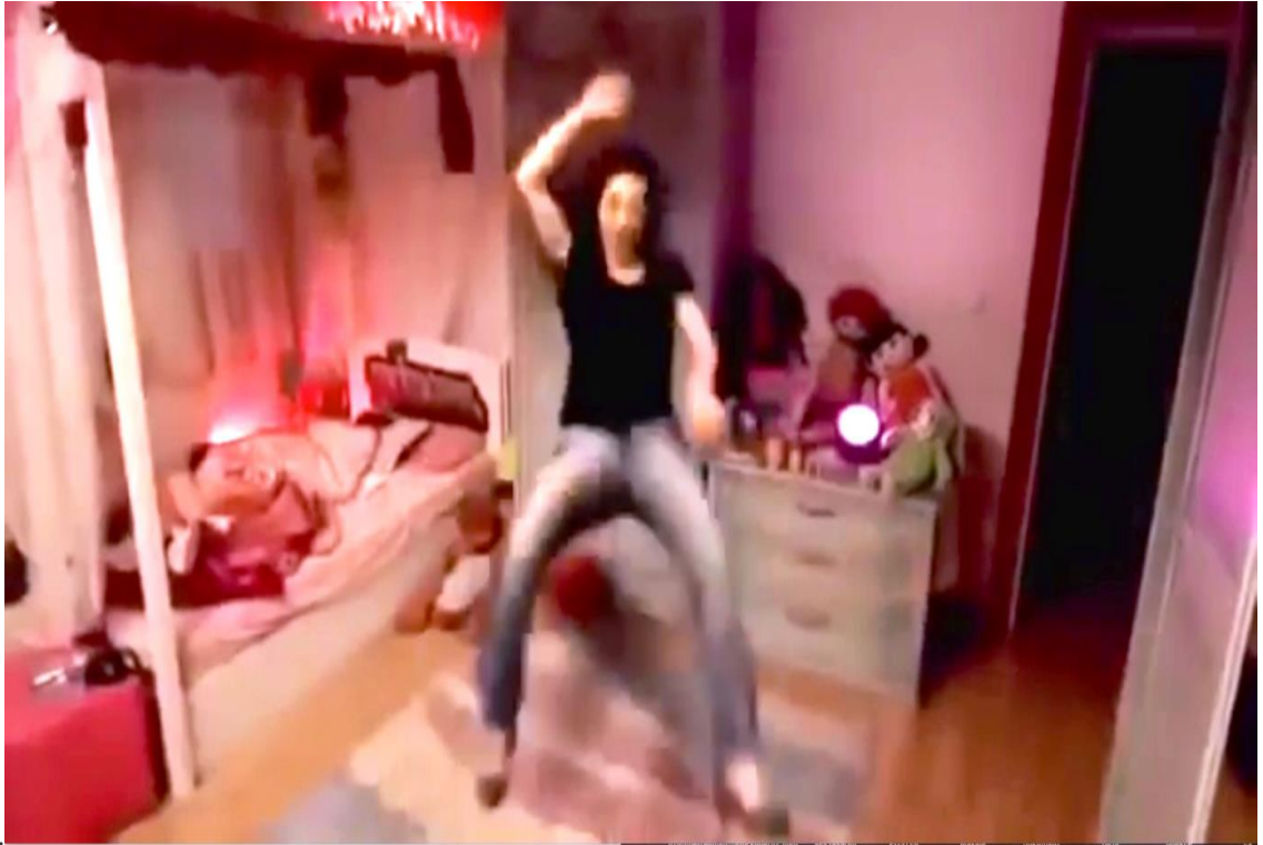
Şekil 8. 3. Dabbe Filmi Yere Düşme Sahnesi