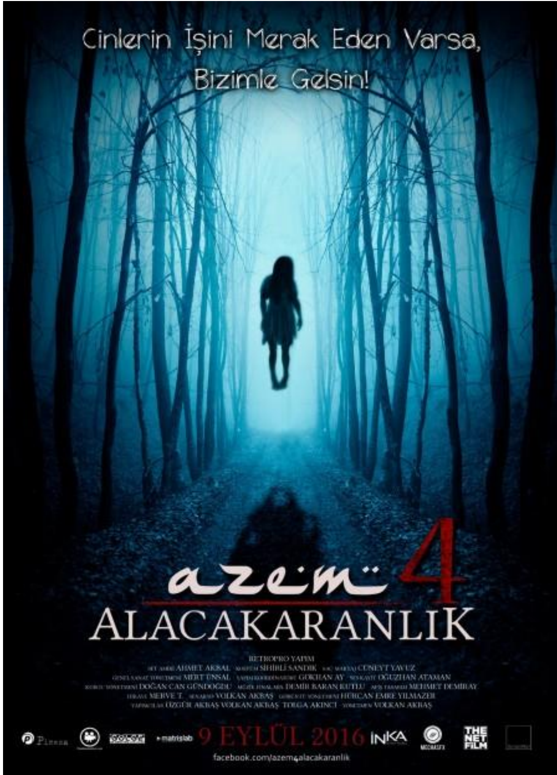
Şekil 11. 3. Azem 4: Alacakaranlık Filminin Afifi