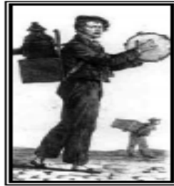
Şekil 1.1. Seyyar Fantazmagorya Şovmeni (Ceram, 2007, s.66).

Sinema tarihi kapsamında korku ilk olarak 18. yüzyılın başında seyyar fantazmagori sunumları yapılmaya başlamıştır. Gezici eğlenceler, halkın gözünde sihirbazlar olarak kabul edilmiş ve saygı görmüştür.