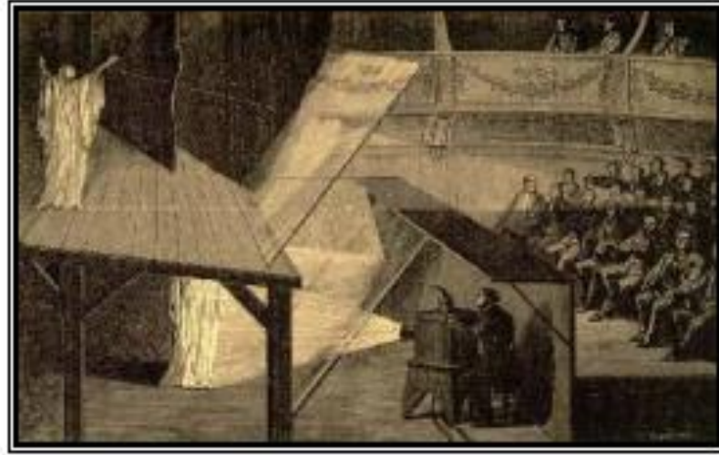
Şekil 3.1. Aygıtın Gizlendiği Gösterimler (Odell ve Blanc, 2011, s.87).

Asıl maksat; İzleyiciye kolay beceri ve yöntemlerle illüzyon sunmaktır. mevzuları kara büyü veya sihirdir; hayaletler, kayıp ruhlar, ölü insanlardır. Amaç, izleyiciyi ‘ölüm ve ölümden sonra var olma düşüncesi’ ile yüzleştirmektir. ‘Gölge oyunu, iki veya daha da fazlası sihirli fenerin kullanılması, gizli yansıma aynalarının kullanımı, geri yansıtma, cama yansıma, duman kullanımı, aşağıdan sahneye yansıtma, nesne hareketini sağlayan gizli fenerin hareketi ve birçok zeki hareketler ile kurgulanmaktadır (Indick, 2011: 116).