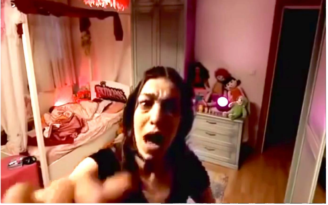
Şekil 7. 3. Dabbe Filmi Cin'le Hayret Sahnesi