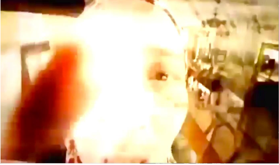
Şekil 5. 3. Dabbe Filmi Cine Yaklaşma Sahnesi