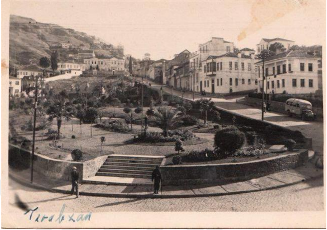
Kaynak: Atilla Alp Bölükbaşı, Eski Zaman Ortahisar , Ortahisar Belediyesi Kültür Yayınları, 2018, s. 64.