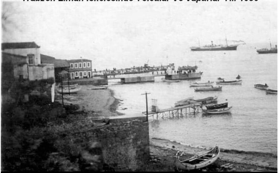
Limanda Bulunan Gümrük Karakol Binası