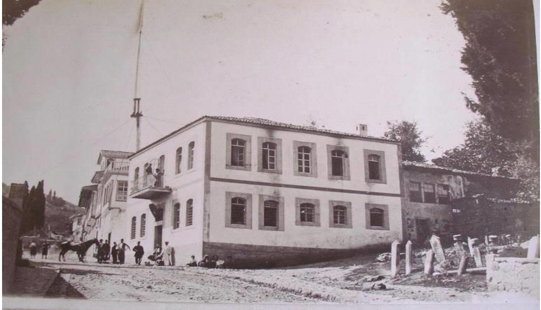
Taksim Parkının Üzerinde Mezarlık Olan Alan ve Sonrasında Mezarlık Üzerine İnşa Edilen Karakol Binası