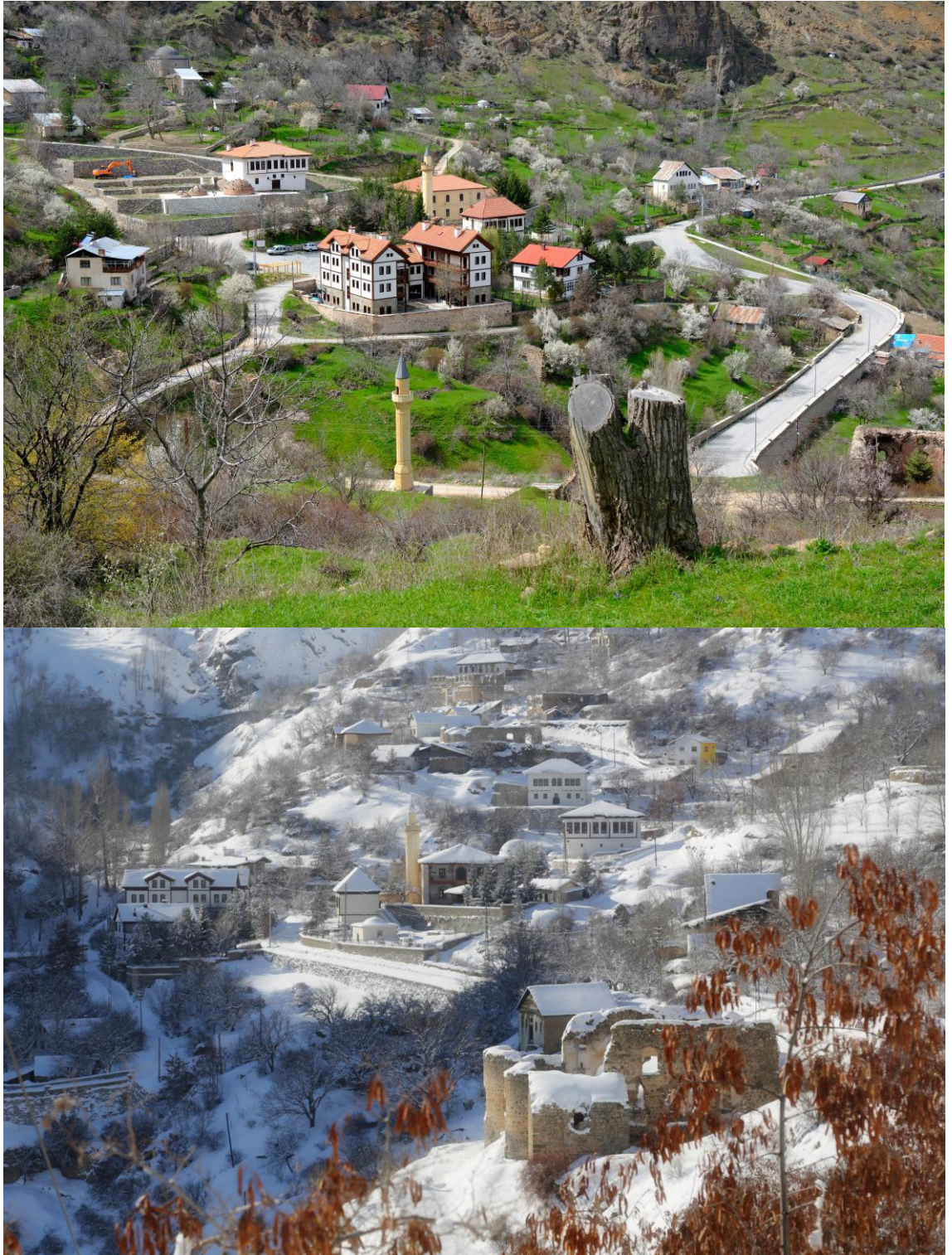
Şekil 3. Süleymaniye Mahallesi'nde ilkbahar ve kış manzaraları (Ergin, 2025)