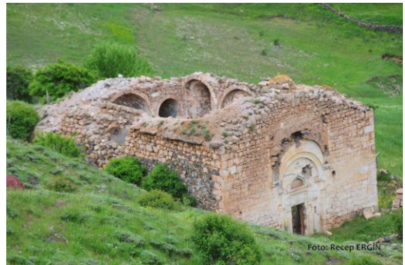
Şekil 4. Kromni Vadisinden Görseller (Ergin, 2025)