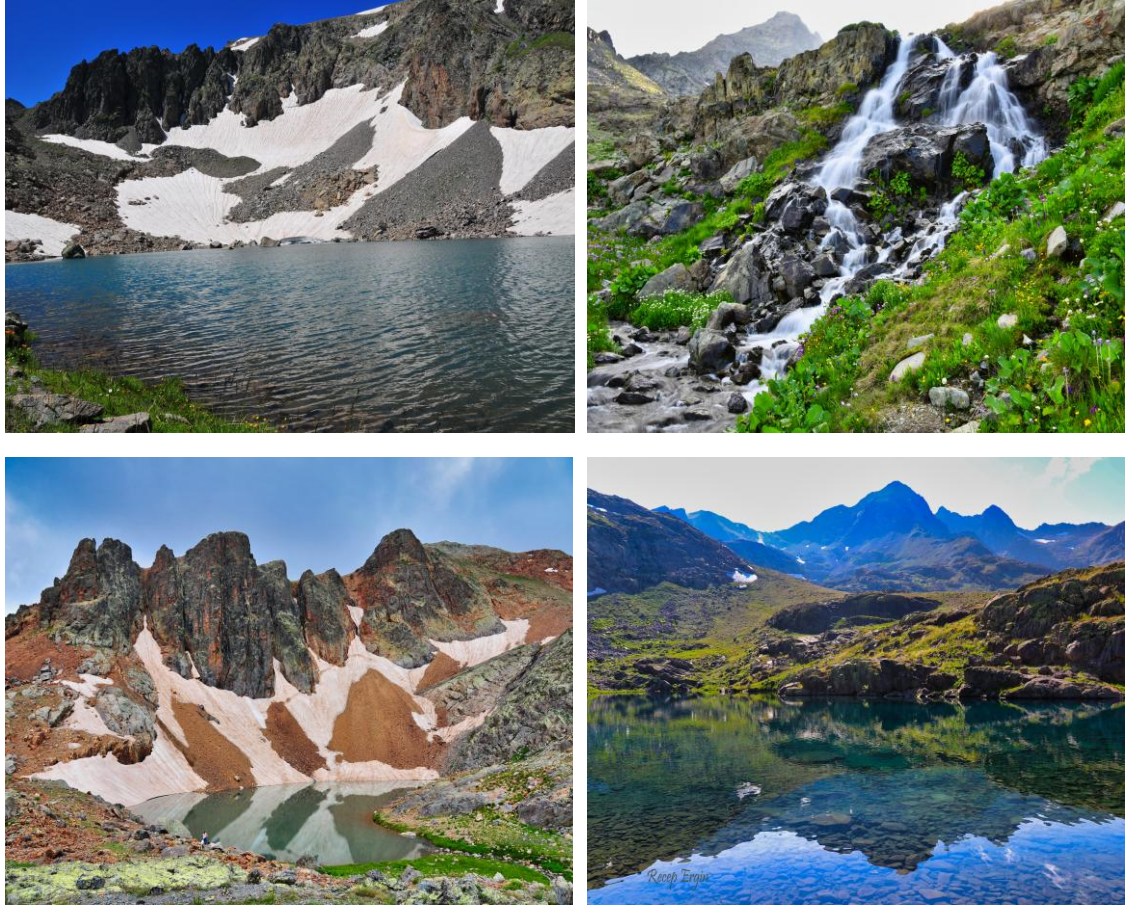
Şekil 5. Artabel Gölleri Tabiat Parkından görseller (Ergin, 2025)