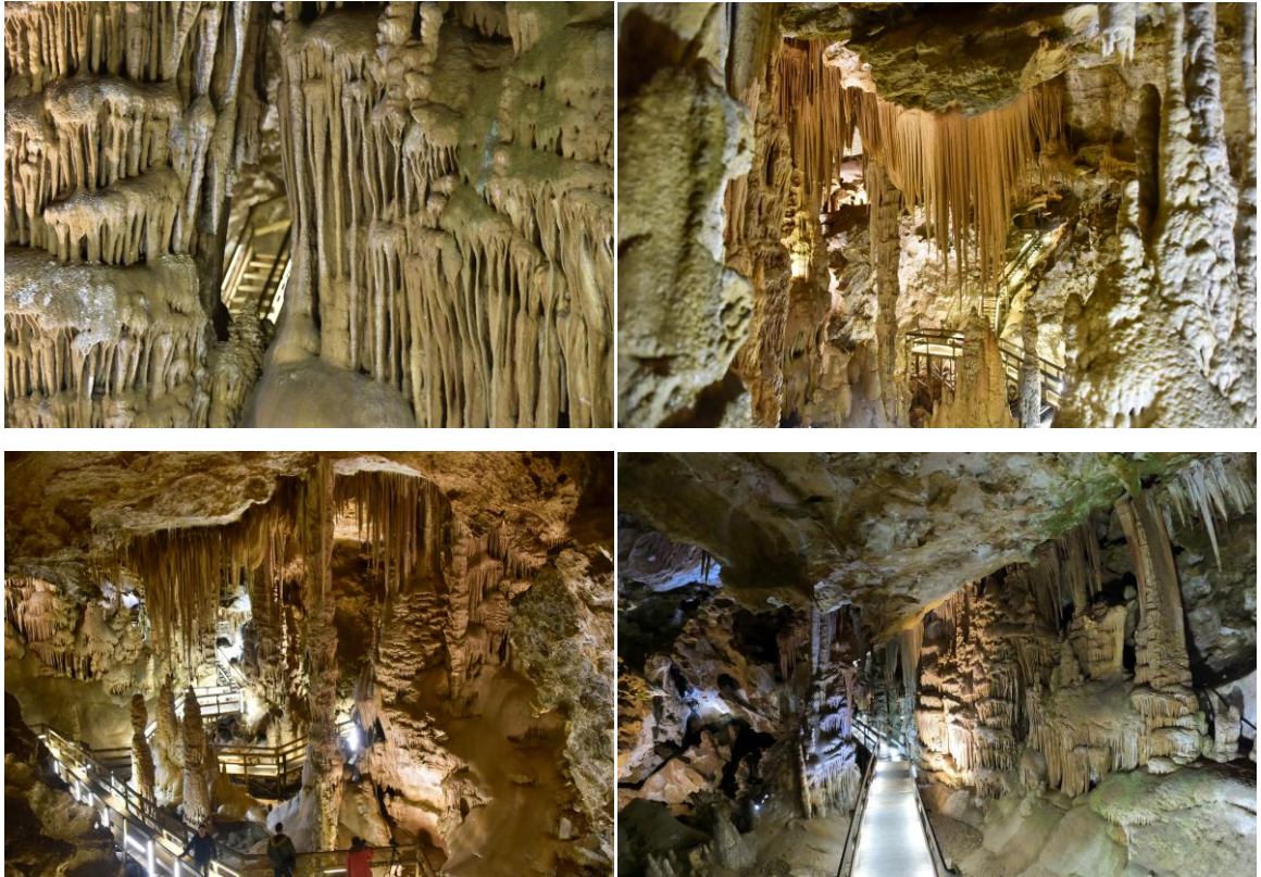
Şekil 6. Karaca Mağarasından Görseller (Ergin, 2025)

genç, ailelerinin inanç farklılığı sebebiyle bu sevdaya karşı çıkması üzerine buluşmalarını gizlice bu mağarada sürdürmüştür. Biri Müslüman, diğeri Rum Hristiyan olan bu iki genç için mağara, dünyanın bütün yasaklarına karşı saklanan bir umut kapısı olmuştur. Gençler, bir gün ailelerinin merhamet göstereceğine ve sevgilerine izin vereceğine inanarak mağaranın yerini sır gibi saklamışlardır. Ancak beklenen gün gelmemiş, zaman onların aleyhine işlemiştir. Bunun üzerine iki sevgilinin, kavuşamayan bütün âşıklar adına kendilerini kaderlerine bıraktıkları anlatılmaktadır. Efsaneye göre bu olaya tanıklık eden tek canlı, çobanın sadık köpeğidir. Köpek, sahiplerinin huzurunu kimse bozmasın diye mağaranın yolunu bir daha göstermemiştir. Yörede anlatılan bir başka rivayete göre mağara, keşfedildikten sonra burada yaşandığına inanılan kara sevdaya duyulan saygı sebebiyle “Karaca” adını almıştır. Tavandan süzülen kireçli suların zamanla iki sevgilinin bedenlerini kapladığı, onların sırt sırta sonsuzluğa dönüştüğü söylenmektedir. Bu sebeple sevdiğine kavuşamayanların bir gün mutlaka Karaca Mağarası’nı ziyaret etmesi gerektiğine inanılır (Gümüşhane İl Kültür ve Turizm Müdürlüğü, t.y.).