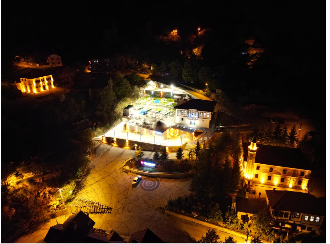
Şekil 2. Süleymaniye Mahallesi’nde akşam manzarası

Bugün Süleymaniye’de yanan ışıklar, bu tarihî yerleşimin canlılığını ve sürekliliğini simgeleyen önemli göstergelerden biri olarak değerlendirilebilir. Osmanlı Devleti’nin yüzyıllar boyunca bölgede kurduğu idarî yapı, toplumsal istikrar ve adalet anlayışının yansımaları ise, kentin tarihî dokusunda ve toplumsal belleğinde günümüzde de hissedilmeye devam etmektedir.