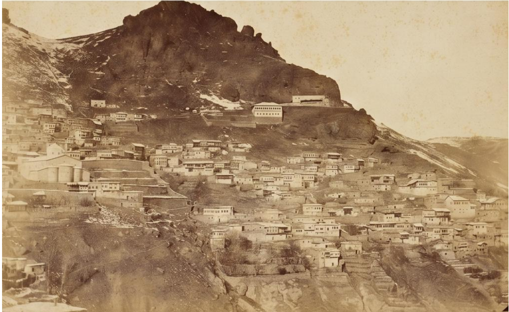
Şekil 1. Sultan II. Abdulhamid Döneminde Eski Gümüşhane (II. Abdulhamid - Yıldız Arşivi, t.y.)