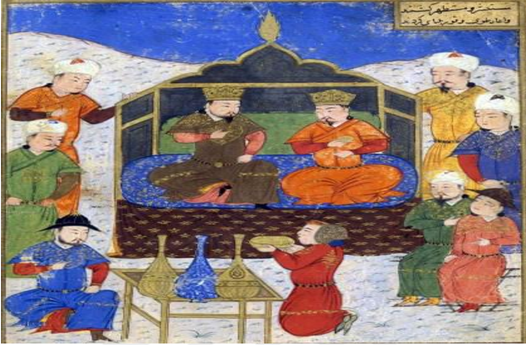
Gazan Han ve kardeři řehzade Olcaytu. 278