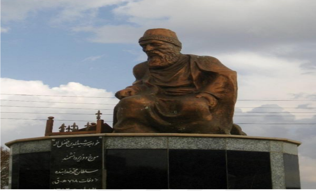
Sultaniye’de yer alan Reşîdüddin Fazlullâh-ı Hemedânî heykeli. 272