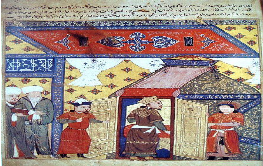
Gazan Han'ın İslamiyet'i kabulü sırasındaki bir tasviri. 277