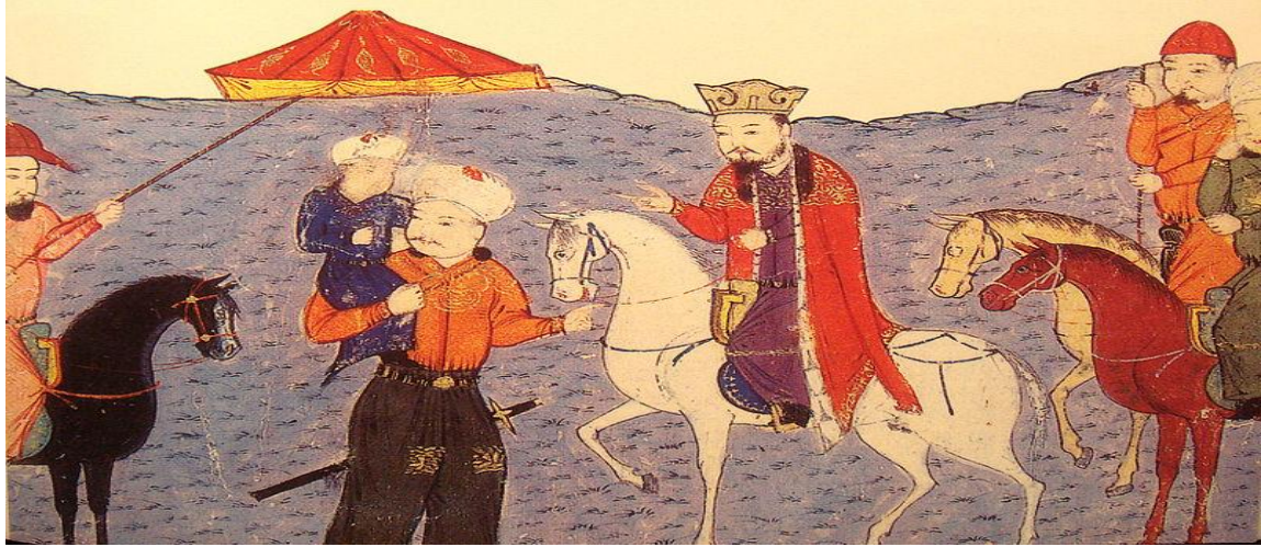
At üzerinde Abaka Han, Argun Han ve omzunda şehzade Gazan. 275