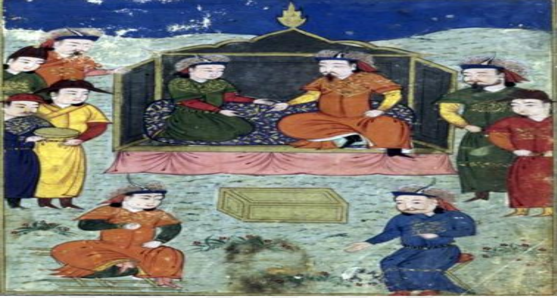
Sultan Ahmed Teküdar ve şehzade Argun. 276