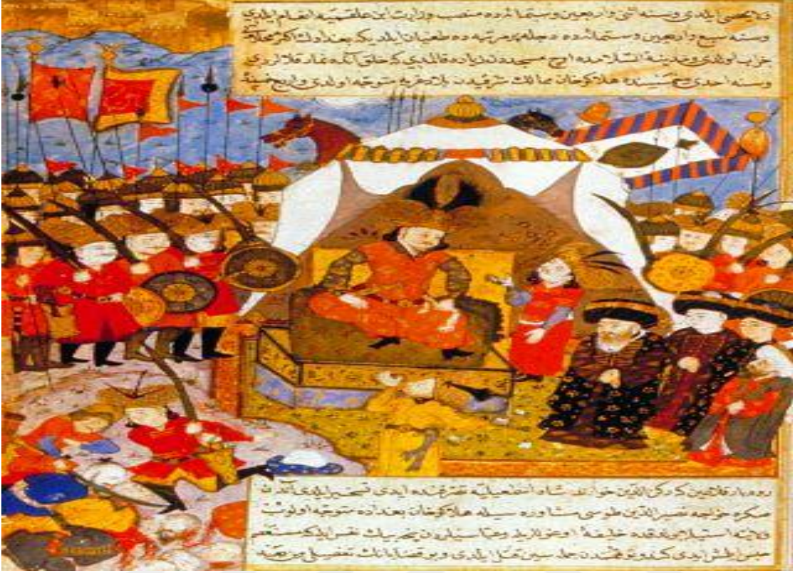
Hülâgû Han'ı tasvir eden bir minyatür. 274