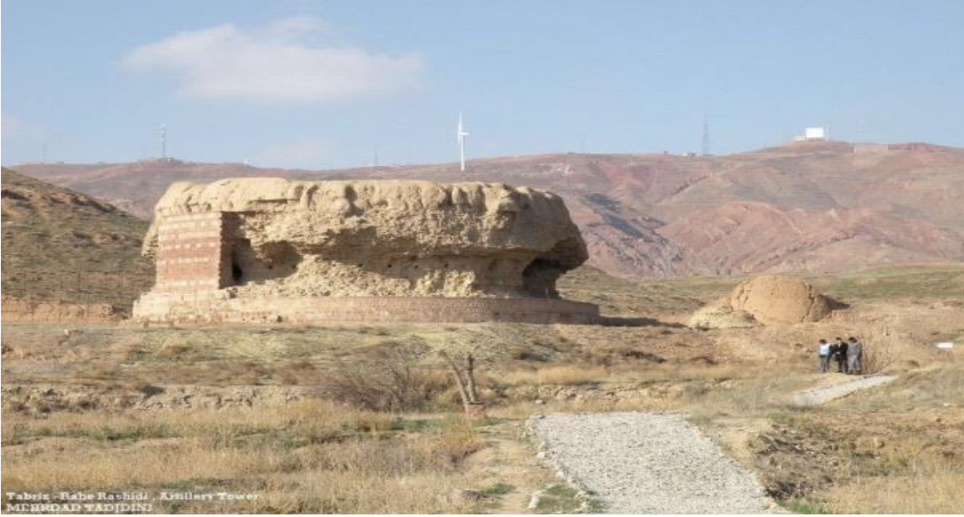
Reşîdüddin Fazlullâh-ı Hemedânî’nin inşa ettirdiği Rab’-i Reşîdî’nin günümüze ulaşan kalıntıları. 273