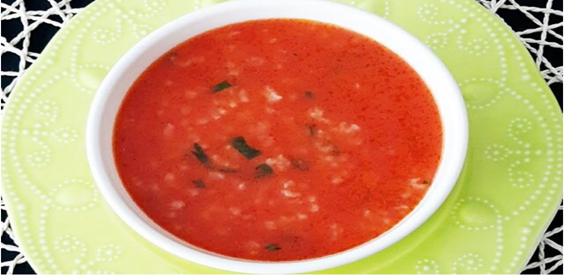
Foto 3. 5. Ekşili pirin orbası (nefis yemek tarifleri. com, 2022)

Hazırlanışı: Ekşili pirin için ocađa uygun tencere alınır. Tencereye zeytinyađı ilave edilir ve zerine ince dođranmıř sođanlar eklenir. Sođanlar pembeleşene kadar kavrulur. Sođanlar pembeleştikten sonra bir yemek kařıđı sala eklenir ve 3-5 dk kavrulur. Ardından baharatlar eklenerek yeteri miktarda su verilir. Su kaynadıktan sonra pirinler eklenir ve kısık ateşte pişmeye bırakılır. Pişmeye yakın, tane sumak suyu eklenir. Kıvamı yoğun bir orba olur. Pişme iřlemi tamamlandıktan sonra sıcak olarak servise sunulur. İsteđe bađlı zerine maydanoz serpilir.