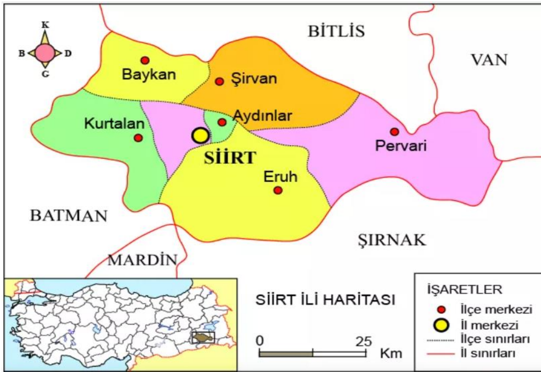
Harita 1.1. Siirt Lokasyon Haritası (cografyaharita, 2022)

Siirt ilinin ekonomisi, başta tarım ve hayvancılık olmak üzere, el sanatları ve sanayiye dayanmaktadır. Ancak Siirt ilindeki sanayi tesislerinin azlığı, tarım ve hayvancılık faaliyetlerinin önemli bir gelir kaynağı olarak işlev kazanmasına olanak sağlamıştır. Nitekim Siirt ilindeki konargöçerlik hayatı, yöredeki hayvancılık faaliyetlerinin sürdürülebilirliği açısından önem taşımaktadır. Göçebe kültürünün etkili olduğu kesimde, göçebeler, özellikle koyun ve keçiden oluşan küçükbaş sürülerini sağarak Siirt'in süt ve peynir üretimine katkı sağlarlar. Meralarda ve yaylalarda, basit çadırlarda barınarak hayvancılık faaliyetlerini devam ettiren göçebeler, günümüzde örneğine az rastlanmakta olan imece usulü ile peynir yapmakta, ekmek pişirmekte ve hayvanları sağmaktadır (Alkan, 2020)