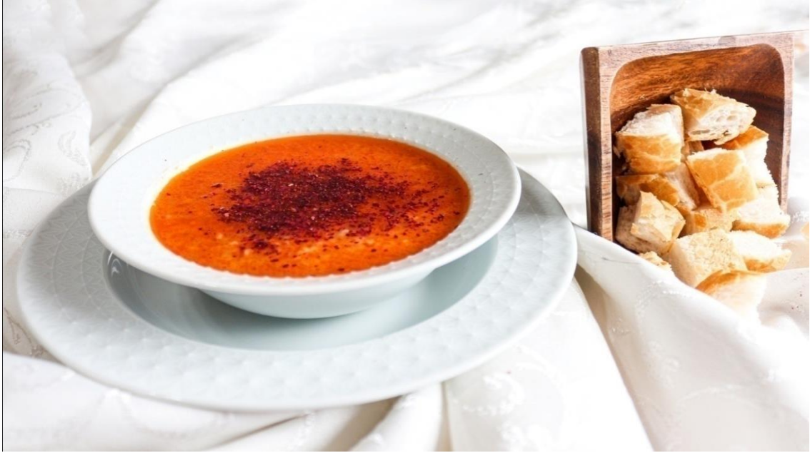
Foto3.3. Bulgur çorbası (Şahin BEŞTAŞ)

Hazırlanışı: Ocağa uygun tencere alınarak tereyağı ilave edildikten sonra küp doğranmış kuru soğan eklenir, soğanlar pembeleşene kadar kavrulduktan sonra bir yemek kaşığı salça ilave edilir. Soğan salçayla birlikte 3-4 dk daha kavrulduktan sonra baharatlar eklenir. Ardından soğanların üzerine bulgur ilave edilerek karıştırılır ve 6-7 su bardağı kaynamış su eklenir. Su eklendikten sonra kısık ateşte 25 dk pişmeye bırakılır. Bulgur, suyunu çekeceğinden suyu takip edilmeli, su eksilmişe su ilavesi yapılmalıdır. Bulgur çorbası ocaktan alındıktan sonra sıcak olarak servise sunulur.