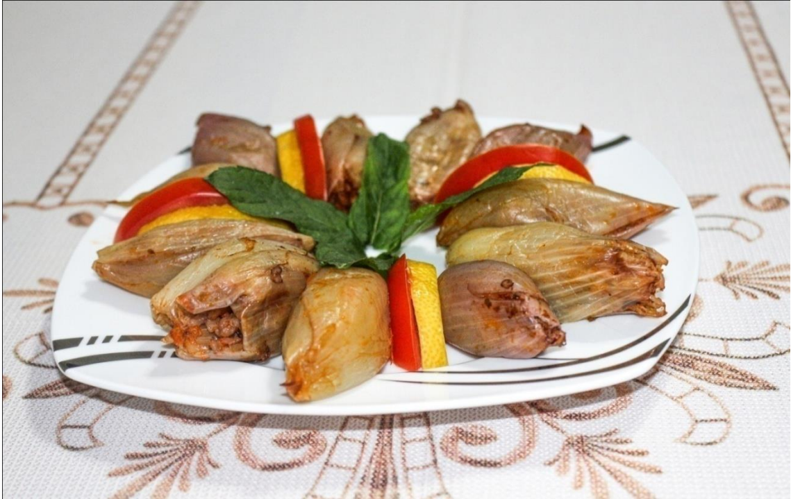
Foto 3.26. Sođan dolması

Hazırlanışı: Dolmal basal iin; seilmiř ince uzun kuru sođanların alt ve st kısımları kesilir, btn halde kaynayan suya atılır. Sođanlar yumuřadıktan sonra sudan ıkarılır ve sođutulur, sođuduktan sonra sođan kesilmeden katlarına ayrılır ve kenarda bekletilirken i har hazırlanır. Kuzu kol kk, kp kp dođranır, sırasıyla domates, sivri biber, maydanoz kp kp kıyıldıktan sonra baharatlarda ilave edilir. Ardından zeytinyađı ve yıkanmıř pirinler de eklendikten sonra sala ilave edilir ve tm har karıřtırılır. Katlarına ayrılmıř sođanların ii doldurulur ve tencerenin ierisine dzgn řekilde dizilir. Dizme iřlemi bittikten sonra zerine kaynamıř su ve daha nceden hazırlanmıř sumak suyu tencereye ilave edilir. Tencerenin kapađı kapatılarak orta ateřte 50 dk piřmeye bırakılır. Piřirme iřlemi tamamlandıktan sonra servis edilir.