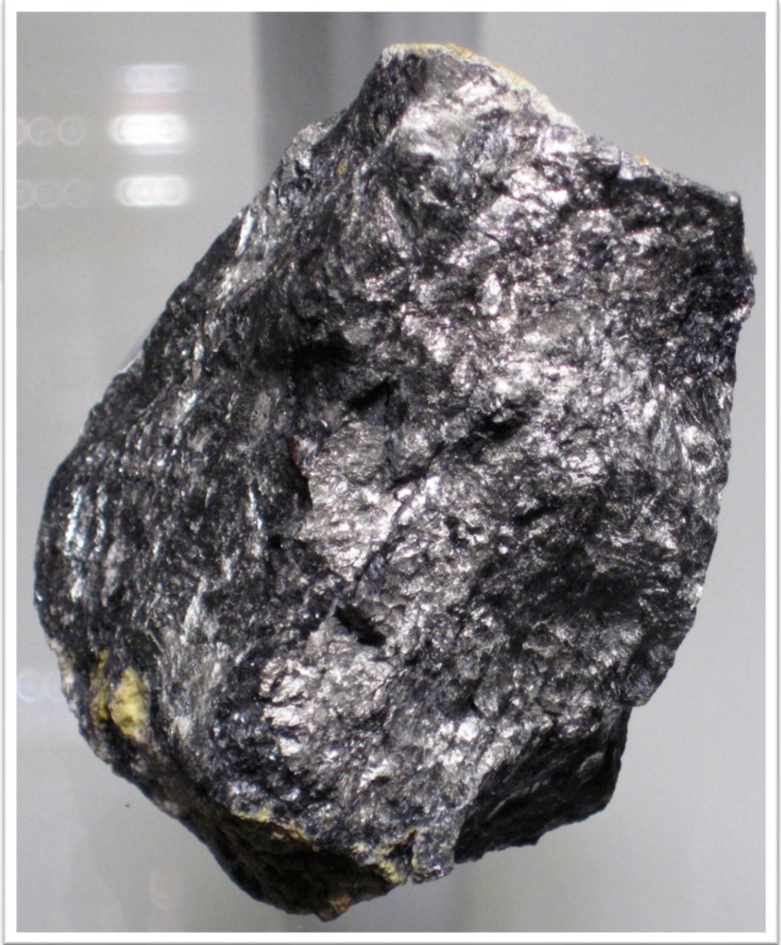
Ek 1. Antimon Madeni