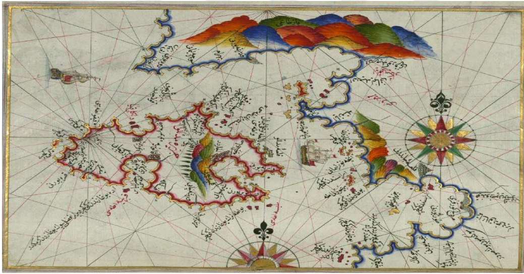
Şekil 1. Edremit ve çevresini gösteren harita. 20