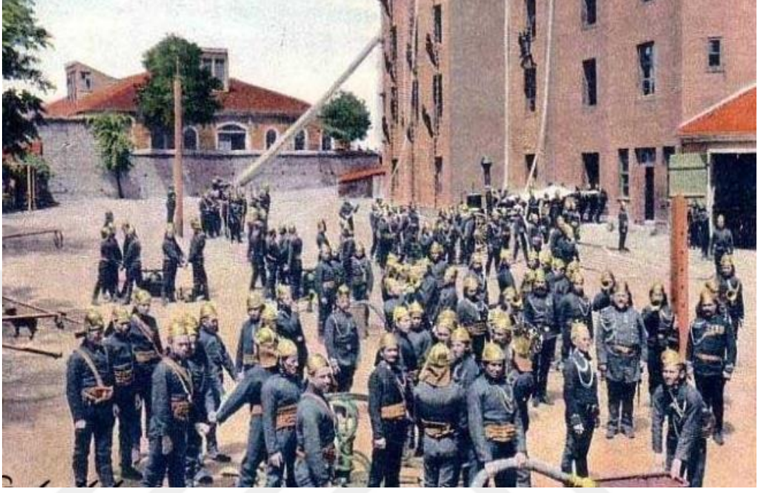
Resim13 İtfaiye yangın söndürme çalışmaları