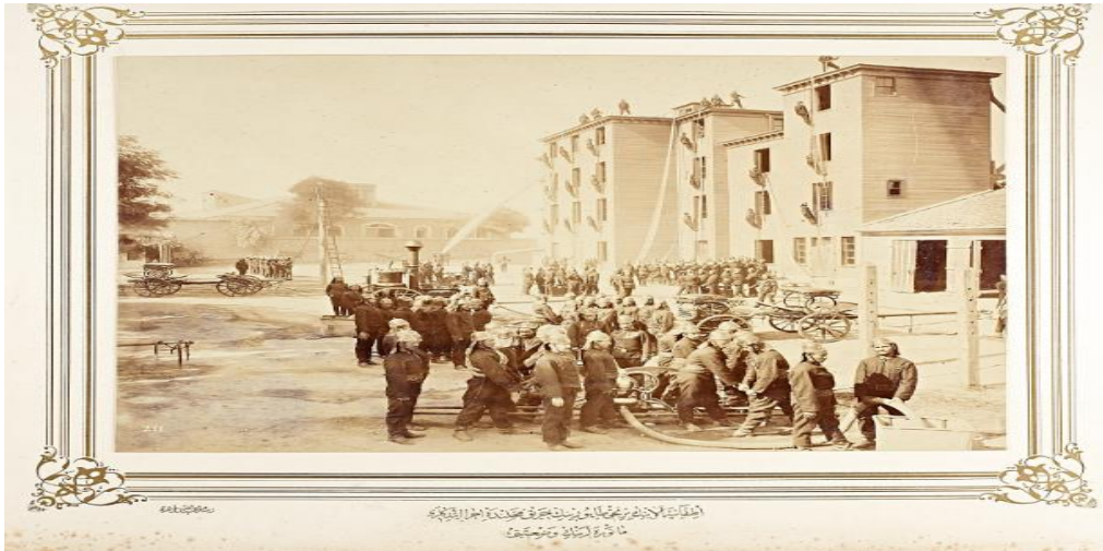
Resim15 İtfaiye Alayı birinci taburun yangın mahallindeki vaziyetleri

(İÜ, Nadir Eserler Koleksiyonu, Sultan II. Abdülhamid Albümü).