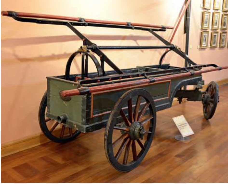
Resim7 Arabalı Tulumba (XIX. Yüzyıl)

(Kuzucu, İstanbul İtfaiyesi, 399-403) (Erişim Tarihi:04.11.2022)