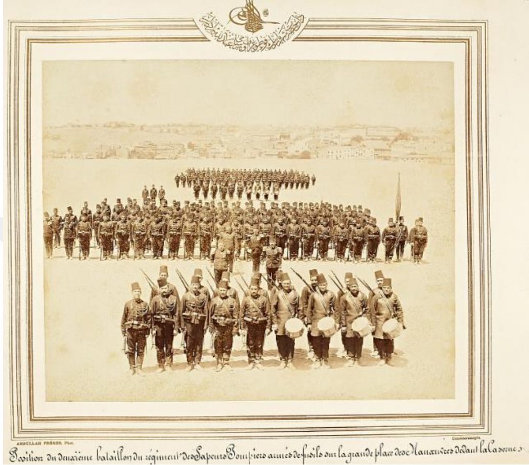
Resim21 İtfaiye Alayı birinci ve ikinci taburları