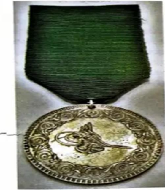
Yeşil kurdeleli madalya

(Kemal Hakan Tekin, “Osmanlı Dönemi Madalyalarından Önemli Bir Örnek Kırım Madalyası”, 278)