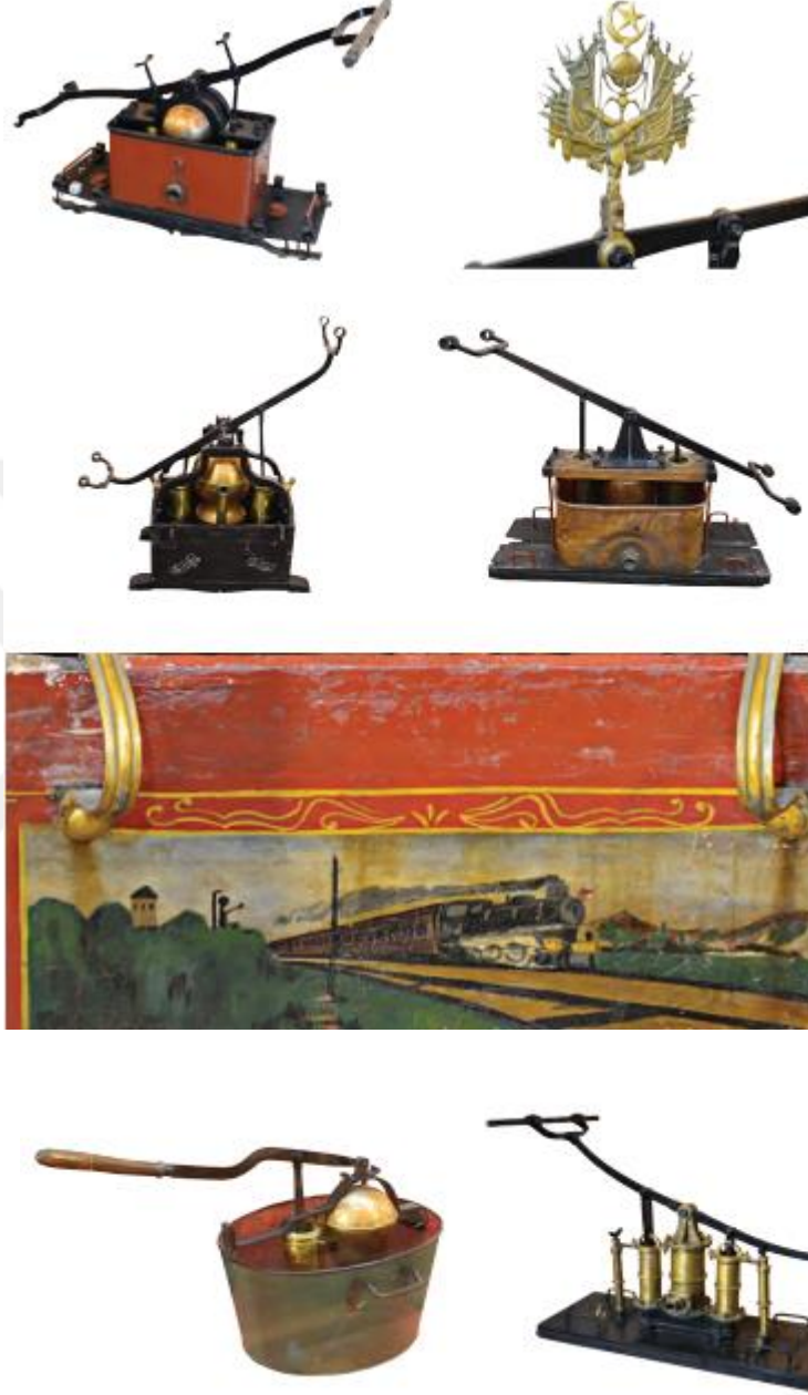
Resim6 Mahalle tulumbaları ve XIX. yüzyıla ait çardaklı tulumbalar

(Kenan Yıldız, “Şehir Topoğrafyasına Etkisi Bakımından Osmanlı Dönemi İstanbul Yangınları”, 498)