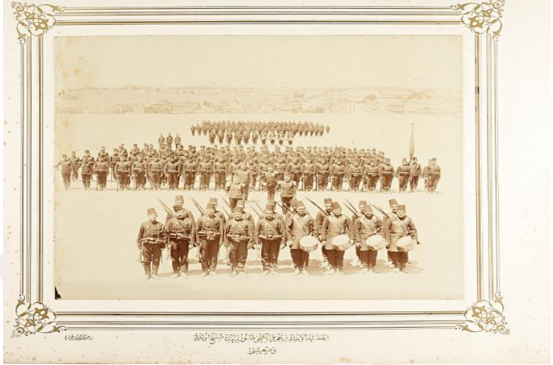
(İÜ, Nadir Eserler Koleksiyonu, Sultan II. Abdülhamid Albümü).