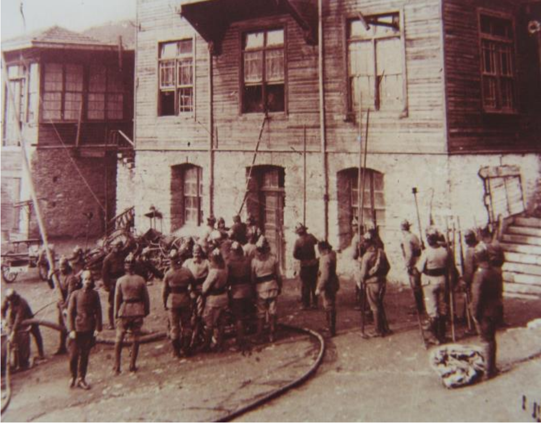
Resim11 İtfaiye teşkilatı, yangın söndürme çalışmaları