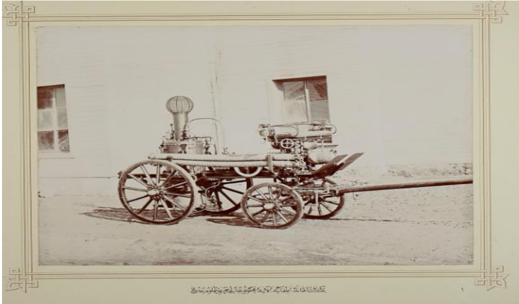
(İÜ, Nadir Eserler Koleksiyonu, Sultan II. Abdülhamid Albümü).