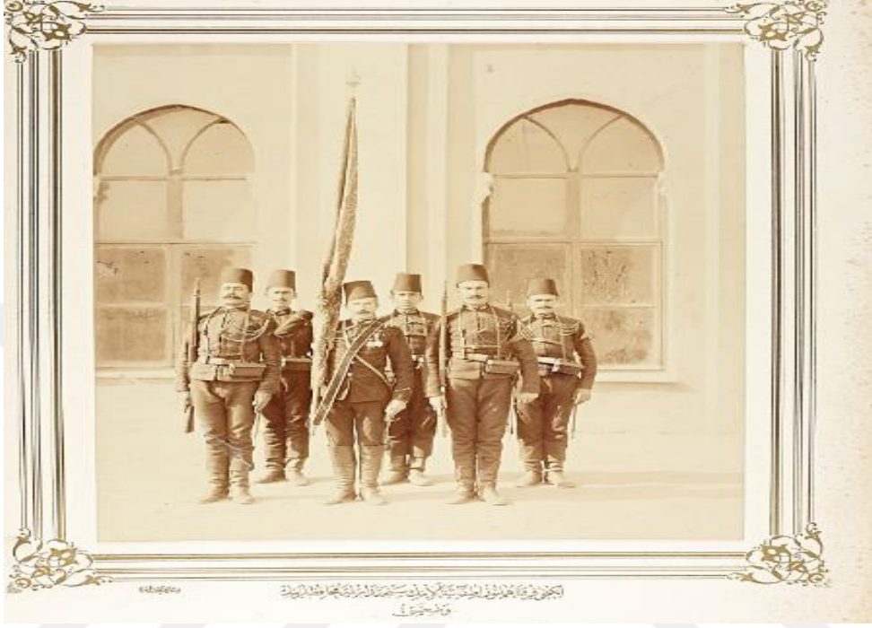
Resim14 İkinci Fırka-i Hümayunu İtfaiye Alayı'nın sancaktarı ve muhafızlar