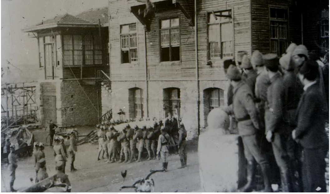
Resim12 Yangın sonrası kurtarma çalışmaları