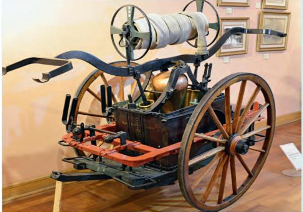
Resim8 Arabalı Tulumba (XIX. Yüzyıl)

(Kuzucu, İstanbul İtfaiyesi, 399-403) (Erişim Tarihi:04.11.2022)