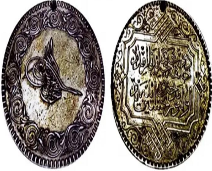
Tahlisiye madalyasının ön ve arka yüzü