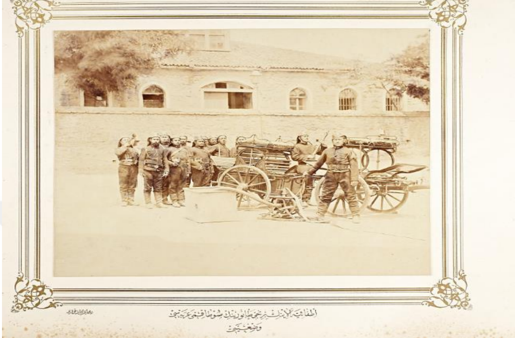
(İÜ, Nadir Eserler Koleksiyonu, Sultan II. Abdülhamid Albümü).