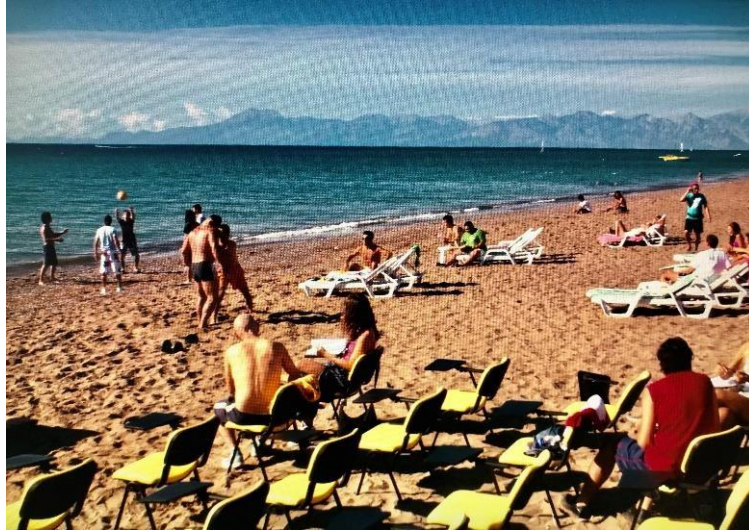
Şekil 3. 4: Tanışma sahnesinden sonraki plaj sahnesi

Tanışma sahnesinden sonra ekrana gelen ilk sahne plajdır ve geniş bir kamera