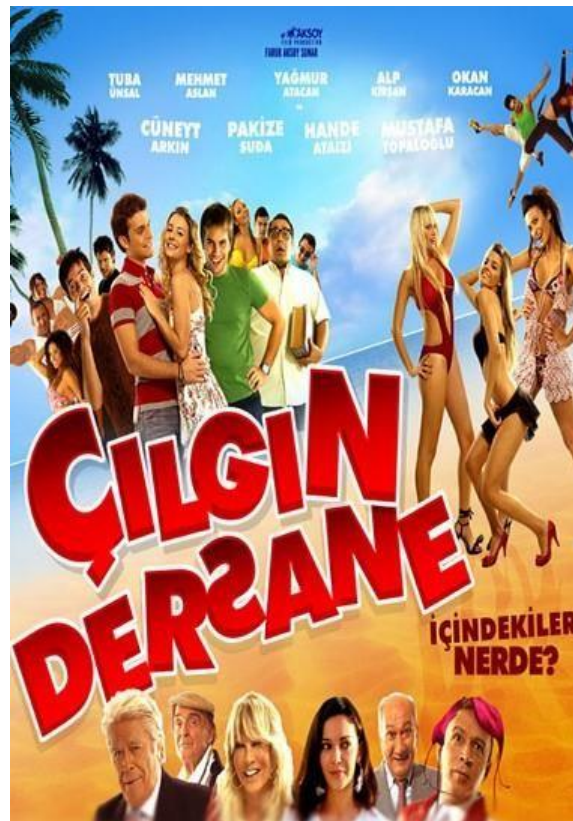
Şekil 3. 1.: Çılgın Dersane Tatilde Film Afışı