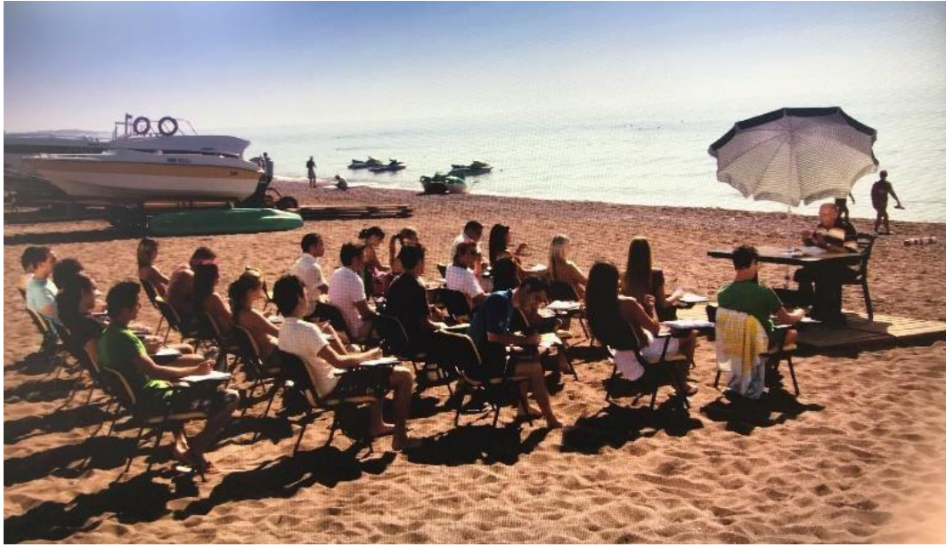
Şekil 3. 8: Plajda oluşturulan diğer sınıf

Öğrenciler kendi mizahları ile komiklikler yaparlar. Bu durum matematik öğretmenin dersinde nispeten daha az yapılır. Filmin alıntı yapısına uygun olarak daha önce tanıtılan karakterlerin yaptığı komiklikler teker teker gösterilmeye başlanır. Yapılan komiklikler karakterlerin yaşlarına uygun olan kültürel mizah usullerini kullanarak yapılır. Öğrenci karakterlerine uygun olan komiklikler müzik ve görsel betimlemelerle desteklenerek türsel alıntı yapısı güçlendirilir.