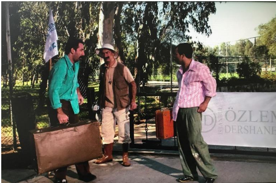
Şekil 3. 2 :Taşralı Öğrenciler Dershaneye Girmeye Çalışmaları

2.Öğrenci Şehmus “ Ha Ziver oğlum bizi almılar ”