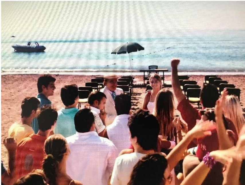
Şekil 3. 3: Plajda kurulan sınıf ortamının gösterilmesi