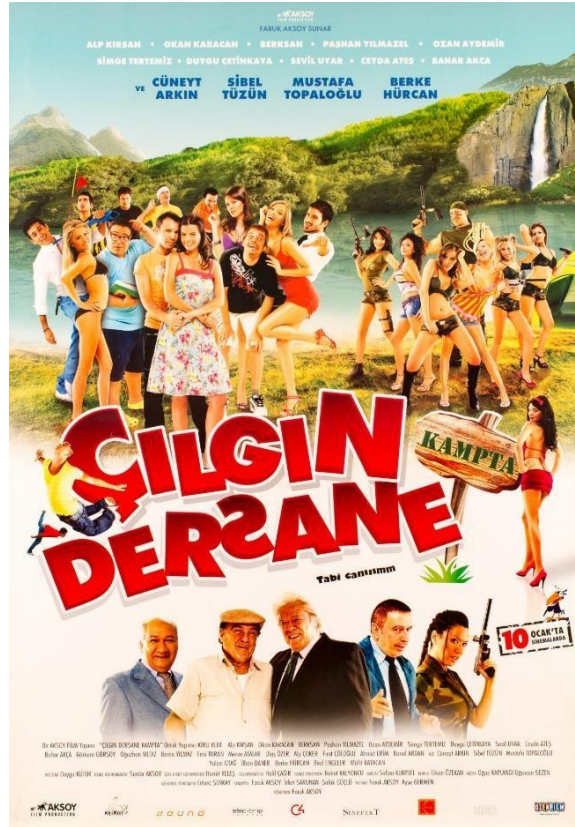
Şekil 3.4. : Film Afışı