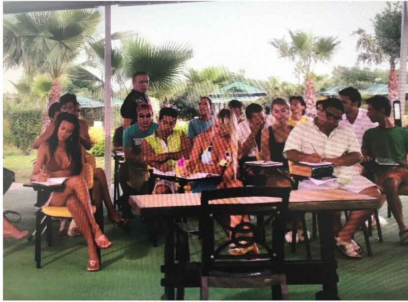
Şekil 3. 6: Açık havada oluşturulmuş sınıf

İlk ders felsefe dersi, öğretmeni de Mustafa Hoca'dır. Mustafa Hoca da öğrencilerin tam olarak istediği bir karakterdir. Öğrencileri sıkmayan ve öğrencilerin ilgisini çekecek bir şekilde hem esprili hem de ergen öğrenciler için cinsellik içeren cümleler ile ders anlatımını yapar. Bu anlatımda Mustafa Hoca kültürel dışı vurumda öğrencilerin kültürüne yakın ve herhangi bir çatışmaya girmeden öğrencilerle anlaşılabilir bir karakter davranışı gösterir. Bu, alıntı yapısına şu şekilde dâhil edilir.