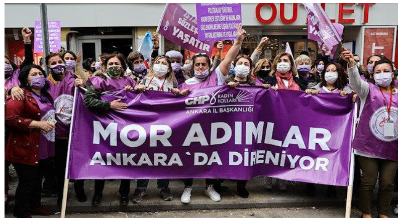
Şekil 4: 16 Nisan 2021 Yeni Şafak Gazetesi