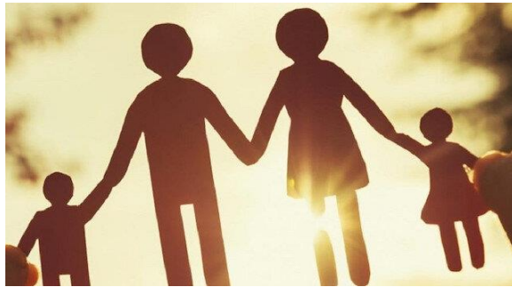
Şekil 3: 20 Mart 2021 Yeni Şafak Gazetesi