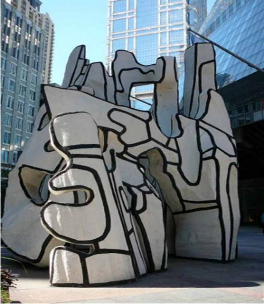
Görsel 2.2.6. Jean Dubuffet, Duran Canavar Anıtı, Kağıt Üzerine Mürekkep, 1984, Chicago.

Duran Canavar Anıtı, Dubuffet'nin Hourloupe serisine dayanan bir başka heykeldir. Parça, Amerika Birleşik Devletleri'nde bulunan üç anıtsal heykelinden biridir. Heykel, bir ağacın, ayakta duran bir hayvanın ve mimari bir yapının soyut bir temsilidir. Çalışma, zihinsel görüntüler ve gerçek nesnelere arasındaki karşıtlığı da oynamasına rağmen, grafiti ve karikatürleri çağırıyor. Ziyaretçi, heykelin siyah beyaz duvarları içinde dolaşmaya ve düşünmeye davet ediliyor (The Art Story, 2023).