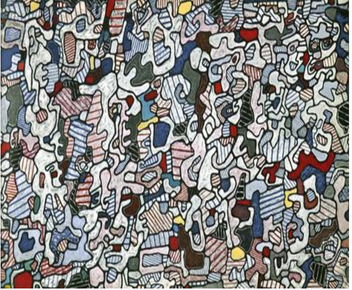
Görsel 2.2.5. Jean Dubuffet, l'Hourloupe, Kağıt Üzerine Mürekkep, Galerie Jeanne Bucher, 1966, Paris.

Dubuffet'nin L'Hourloupe serisi 1962'de başladı ve sanatçıyı onlarca yıl meşgul etti. İlham, hareket oluşturmak için çizginin akıcı hareketinin sınırlı renk alanlarıyla birleştiği telefonda yaptığı bir karalamadan geldi. Tarzın, nesnelerin zihinde görünme biçimini çağrıştırdığına inanıyordu. Fiziksel ve zihinsel temsil arasındaki bu zıtlık, daha sonra onu bu yaklaşımı heykel yaratmak için kullanmaya teşvik etti (The Art Story, 2023).