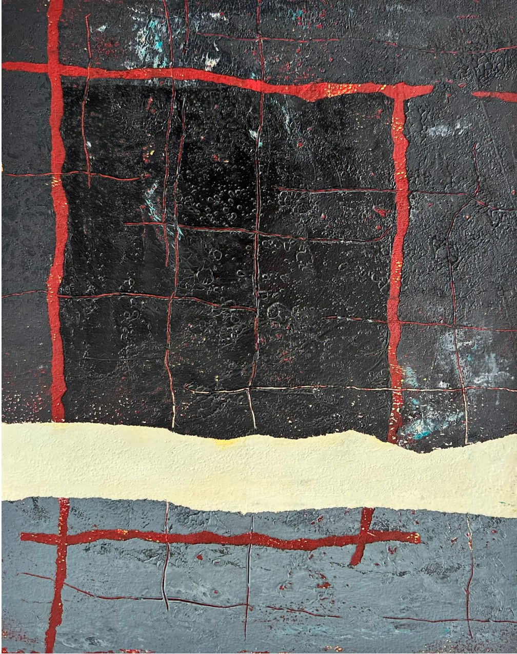
Görsel 4.10. Mehmet Çelik, Kapı 9, Kağıt Üzerine Karışık Teknik, 24x34 cm, 2022.