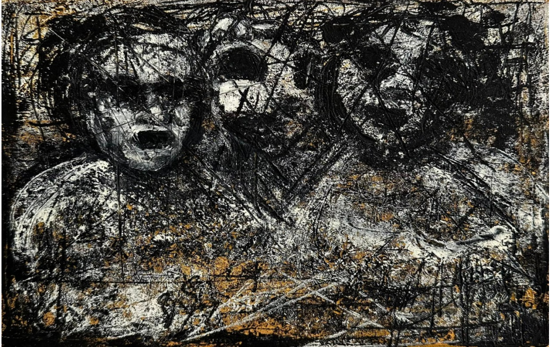
Görsel 4.3. Mehmet Çelik, İsimsiz, Kağıt Üzerine Karışık Teknik, 24x34 cm, 2021.