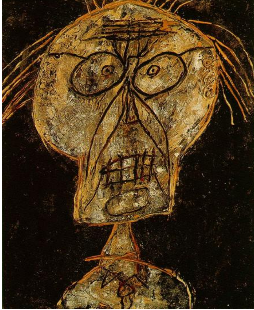
Görsel 2.2.2. Jean Dubuffet, Grand Maitre Of The Outsider, Tuval Üzerine Yağlıboya, 1947.

Bu resim, Dubuffet'nin 1946'da büyük tartışmalara yol açarak sergilediği Hautes Pates serisinin tipik bir örneğidir. Kalın, tek renkli bir yüzey, bir portre parodisi olan, kabaca tasvir edilen figür için zemin görevi görür. Dubuffet şüphesiz seriyi rencide etmeyi amaçlamış olsa ve grafik stili ve kalın, kaba impasto kesinlikle geleneksel zevkleri rencide etse de, renk paletinin olabileceği kadar sarsıcı olmadığını belirtmekte fayda var. Dubuffet en azından ihtiyatlı bir şekilde başarıya duyulan ihtiyacın farkındaydı (The Art Story, 2023)