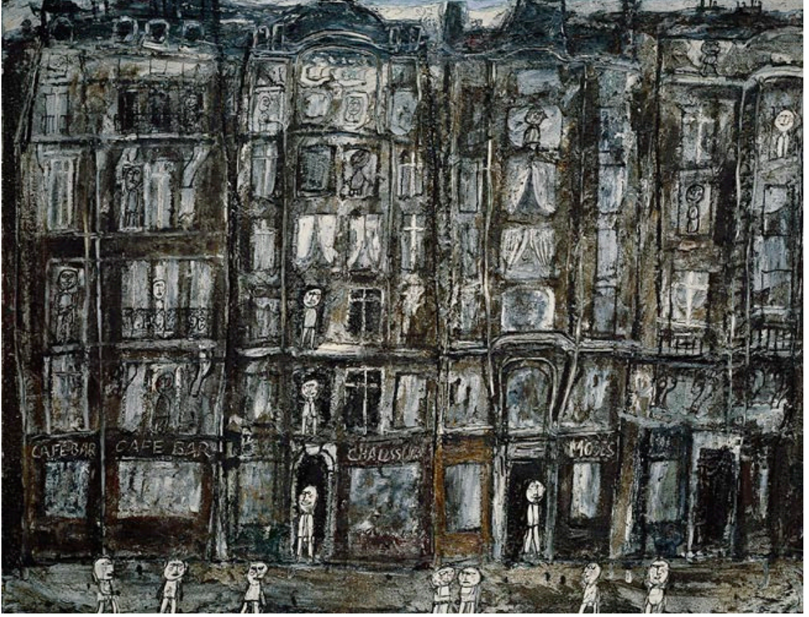
Görsel 2.2.1. Jean Dubuffet, Apartment Houses, Tuval Üzerine Yağlıboya, 1946.

Apartman Evleri, Paris tablosu kent yaşamına odaklanıyor. Binalar, mimari bütünlüğe şakacı bir şekilde meydan okuyarak eğimlidir. Gökyüzü, binalar ve siviller arasındaki boşluğun düzleşmesi kendiliğinden ve işlenmemiş - çocuksu görünmektedir. Burada Dubuffet, Paris'in geleneksel, duygusal görüntülerini hicvediyor ve bunun yerine şehrin sakinlerinin neşesinin zorlama ve yanlış olduğunu öne sürüyor (Wisual Art Encyclopedia, 2023).