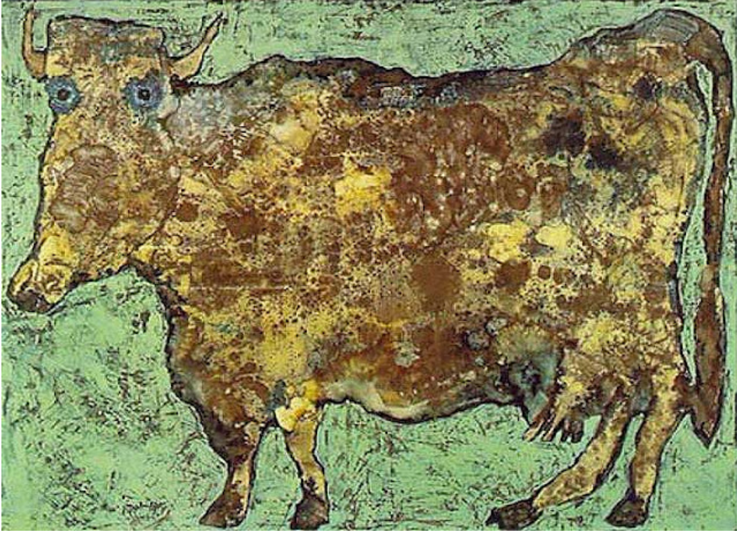
Görsel 2.2.3. Jean Dubuffet, The Cow With The Subtle Nose, Tuval Üzerine Yağlıboya, Moma, 1954, New York.

Dubuffet'nin taşradaki baş döndürücü deneyimi ve sanat eğitime karşı çıkışı bu tabloda belirgindir. Ağır dokulu yüzey, psikolojik tesislerde tutulan hastaların çocuksu masumiyetinde işlenen bir ineği tasvir ediyor. Tuvale sınır tanımayan, vahşi yaklaşım, Dubuffet'nin Art Brut olarak adlandırdığı kavramın örneklerini oluşturuyor. Görüntü, manzara geleneklerinde tamamen eğitimsiz görünüyor. Bu nedenle görüntü, "yüksek sanat" kavramlarıyla çelişir ve sanat yapımına kültürel ilerlemeden etkilenmeyen sanatsal saflık yönünden yaklaşır. Bir adım daha ileri giderek Dubuffet, sanata yönelik "kültürel" ve "vahşi" yaklaşımların birlikte nasıl medeniyeti bir bütün olarak yeniden teyit etmeye çalıştığını öne sürüyor (The Art Story, 2023).