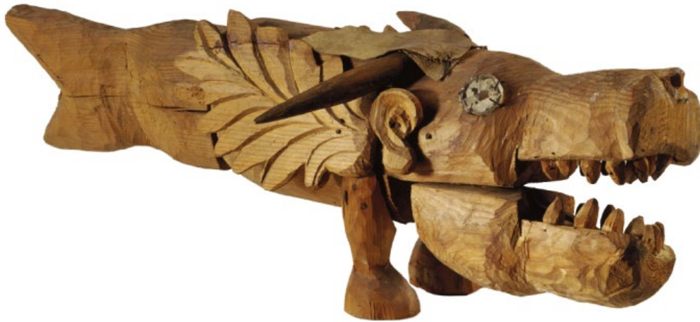
Görsel 3.1.4.1. Auguste Forestier, İsimsiz, Ahşap Oyma, 70 cm uzunluk, 1949

Daha sonra, hastanenin koridorunda küçük bir atölye kurdu ve burada bir ayakkabıcının dilimini kullanarak kurtarılmış ahşap parçalarından karakterleri, hayvanları ve antropomorfik figürleri oydu. Forestier, heykelciklerini kumaş veya deri, madalyalar, ipler ve hurdalardan toplanan çeşitli atıklarla eşleştirir (Collection De L'Art Brut Lausanne, 2023).