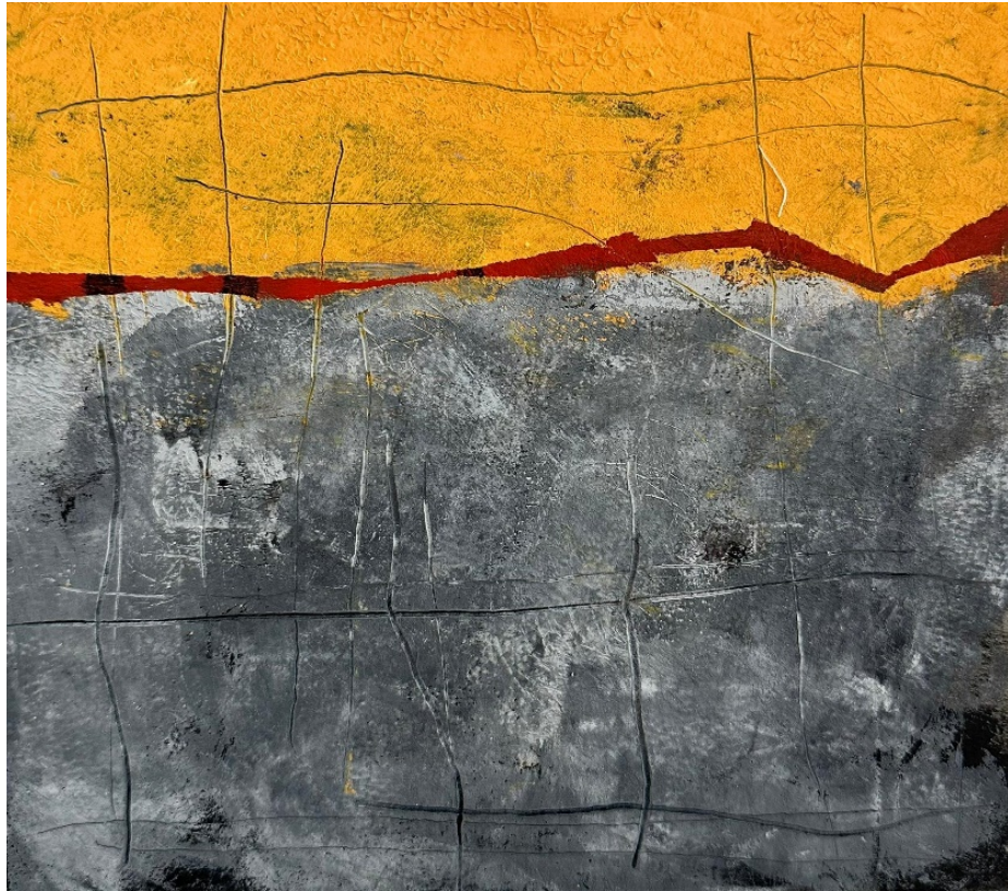
Görsel 4.5. Mehmet Çelik, Yol 5, Kağıt Üzerine Karışık Teknik, 24x34 cm, 2022.