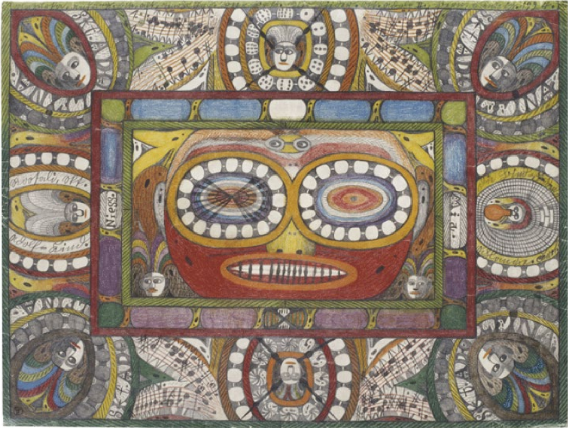
Görsel 3.1.2.1. Adolf Wölfli, Niess ve Mia arasında gözlük takan Aziz Adolf, Kağıt Üzerine Renkli Kalem, 51x68 cm, 1924.

Adolf Wölfli otuz beş yaşında çizim yapmaya, yazmaya ve müzik bestelemeye başladı. Çalışmaları, renkli kalemlerle yapılan grafik kompozisyonların dağıtıldığı yirmi beş bin sayfa, aynı zamanda kolajlar, edebi kreasyonlar ve müzik notaları içermektedir. Çizimlerinde, gözleri bir maske ile çevrili karakterler müzik notaları, metin parçaları ve parlak renkli şekillerle karışıyor. Süs elemanları hem dekoratif hem de ritmik bir işleve sahiptir (Colecction De L'Art Brut Lausanne, 2023).