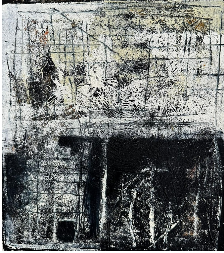
Görsel 4.6. Mehmet Çelik, Kapı 1, Kağıt Üzerine Karışık Teknik, 24x34 cm, 2022.