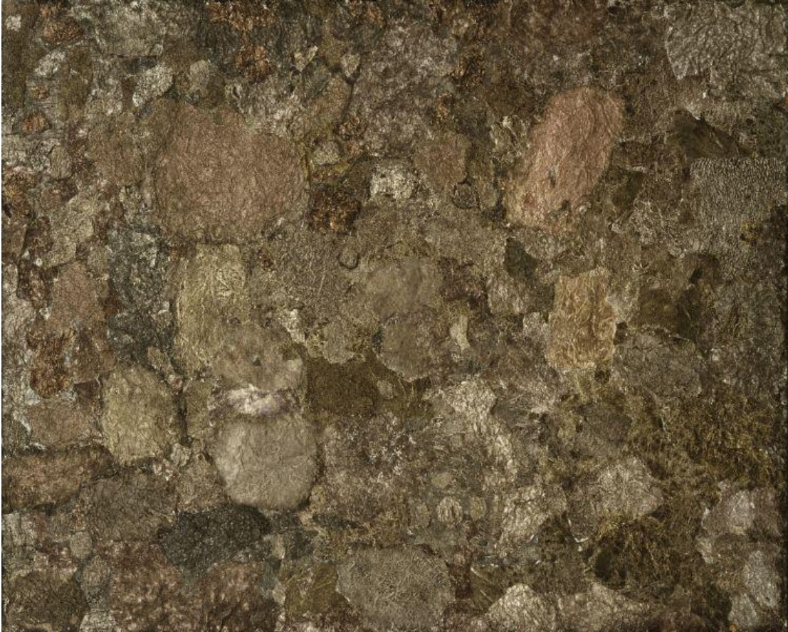
Görsel 2.2.4. Jean Dubuffet, Soul of the Underground, Tuval Üzerine Yağlıboy, Moma, 1959, New York.

Yeraltının Ruhu, Dubuffet'nin dokuya olan hayranlığını ve temsili resimden ayrılışını örneklemektedir. Jean Fautrier'in tablolarının yüzey kalitesinden ilham alan Dubuffet'in alüminyum folyo ve yağlı boya kullanımı, mineral birikintilerini andıran kaba, pürüzlü bir yüzey oluşturuyor. Dubuffet, katıksız maddeyi ve katıksız işlenmemiş malzemeyi anımsatmak için burada resimsel temsili tamamen terk ediyor. 1950'ler boyunca farklı doku türlerini çağrıştırmakla daha fazla ilgilenmeye başladığında üzerinde çalıştığı bir doku bilimi parçasıdır.