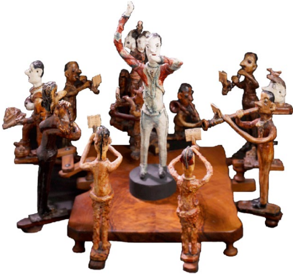
Görsel 3.1.5.1. Joseph Giavarini, İsimli, Heykel, 37 cm uzunluk, 1934.

Hücrelerinde tek başına, parmaklarının arasında yoğurduğu ekmeğin kırıntılarıyla, daha sonra ziyaretleri sırasında ailesi tarafından kendisine sağlanan pişmemiş toprakla figürin grupları yapmaya başladı. Heykelcikleri modelledikten sonra, vernikli bir görünüm vermek için güçlü yapıştırıcıya batırmadan önce boyar. Topluluk, alışılmadık bir hayranlık eşliğinde elastik ve orantısız uzuvlara sahip akrobatları temsil ediyor (Collection De L'Art Brut Lausanne, 2023).