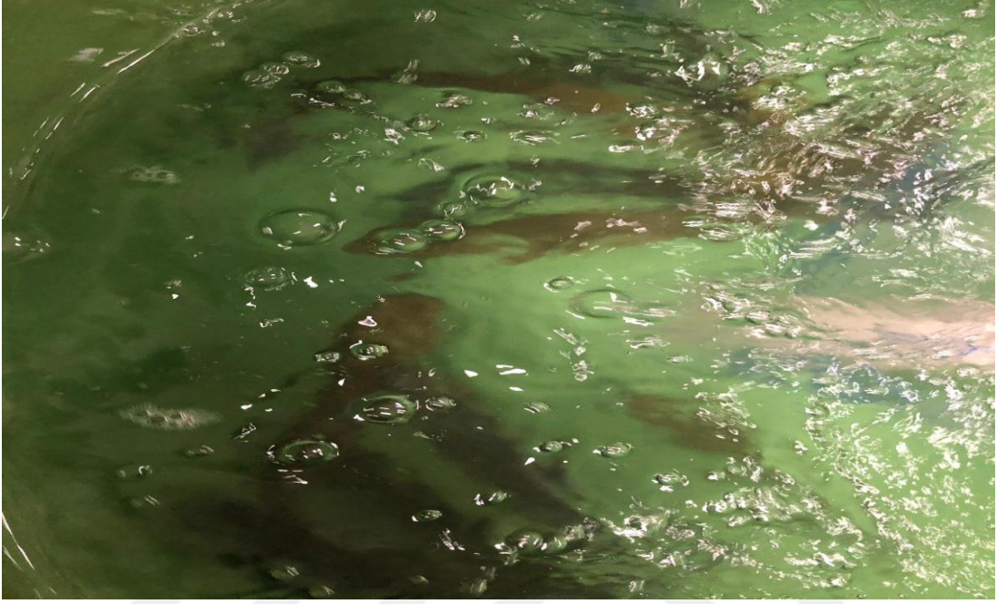
Şekil 2.4. Denemede kullanılan alabalıkların yemlenmesi. (Orjinal).

Hazırlanan yemler 21 gün boyunca alabalıklara günde bir kez doyuncaya kadar verildi.