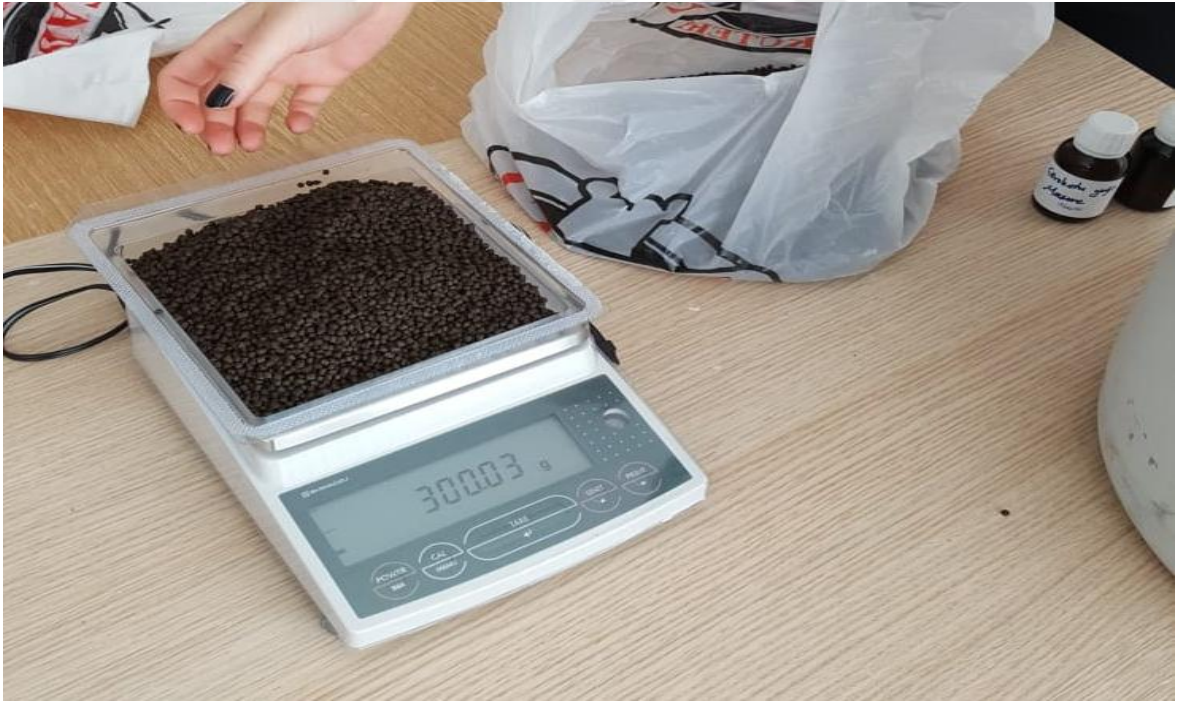
Şekil 2.3. Yağlar eklenmeden önce alabalık pelet yemlerinin tartılması (Orjinal).

Çalışma sonundaki yem tüketimini tespit etmek amacıyla, yemleme yapılmadan önce her bir yem grubu ayrı ayrı tartıldı. Çalışma sonunda kalan yemler tekrar tartılarak toplam yem tüketimi her grup için tespit edildi.