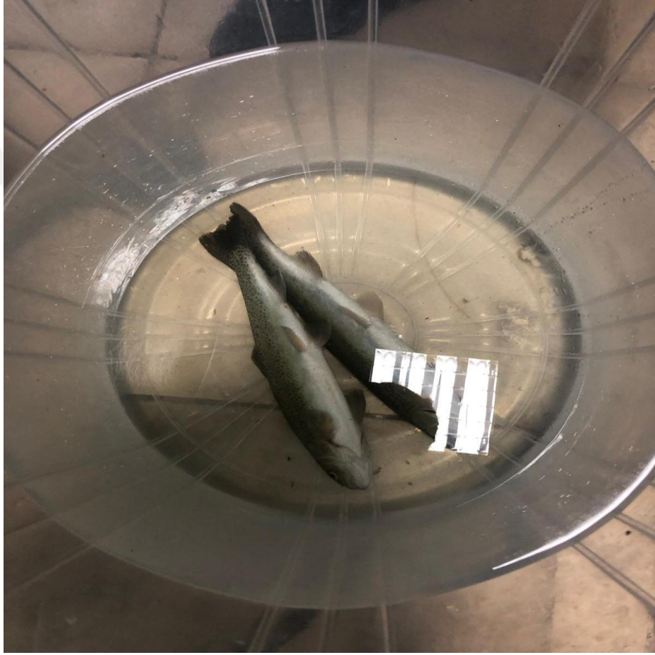
Şekil 2.5. Balıkların anestezi içinde bayıltılması (Orjinal).

Bu Tezin yürütülebilmesi için, İnönü Üniversitesi Tıp Fakültesi Deney Hayvanları Etik Kurulu tarafından 2018/A-02 referans numaralı belge alınmıştır.