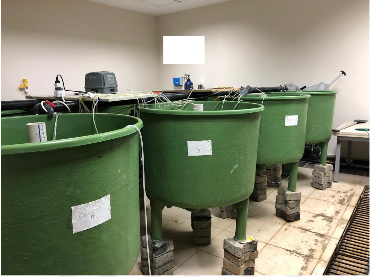
Şekil 2.1. Çalışmanın yapıldığı kapalı devre sistemi (Orjinal).