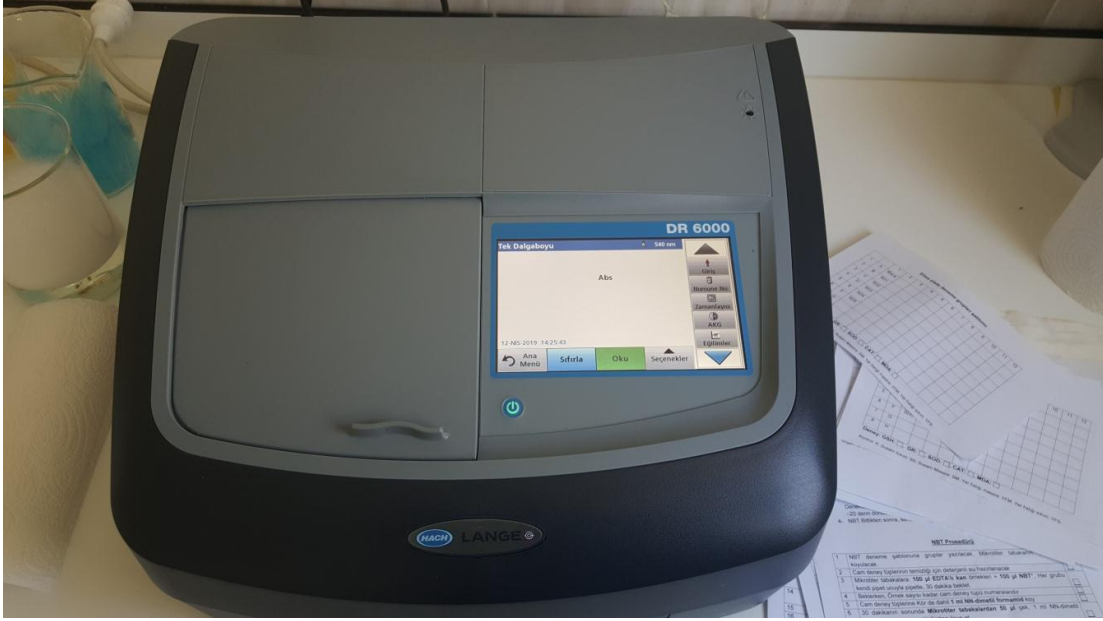
Őekil 2.7. NBT analizlerinin yapıldıęı Hach Lange DR6000 spektrofotometre (Orjinal).

(pH 7,2) ile yavaşça yıkanarak lamelden uzaklaştırıldı. PBS ile yıkanan lamel cama yapışan n6trofiller ve bazı monositler altta kalacak şekilde, 6zerine 50Pl NBT (%08,5 NaCl'de ve %02'lik) solusyonu damlatıldı, lam 6zerine kapatılarak oda sıcaklıęında 40 dk. ink6be edildi. Daha sonra spektrofotometre (Hach Lange DR6000, Őekil 2.7.) ile NBT analizi yapıldı.