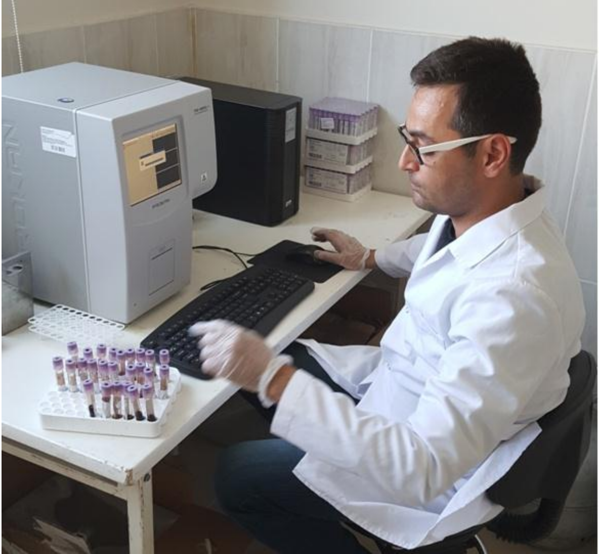
Şekil 2.6. Procan tam kan sayım cihazı ile kan örneklerinin analizi (Orjinal).

ortalaması (MCH), Hücre hemoglobin yüzdesi (MCHC), Kırmızı kan hücresi dağılım genişliği standart sapma (RDW-SD), Kırmızı kan hücresi dağılım genişliği-varyasyon katsayısı (RDW-CV), Trombosit (PLT), Ortalama trombosit hacmi (MPV), Trombosit dağılım genişliği (PDW), Trombosit yüzdesi (PCT), Trombosit-hücre genişliği oranı (P-LCR) değerleri ölçüldü (Şekil 2.6).