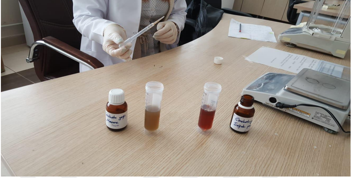
Şekil 2.2. Yağlarının yeme karıştırılmak üzere hazırlanması (Orjinal).